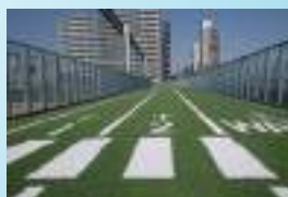
ランニングウェイ