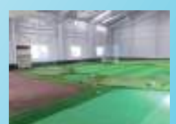
室内ゴルフ練習場