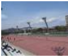
人工芝クレーコート