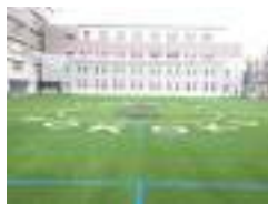
ロゴ入りサッカー場