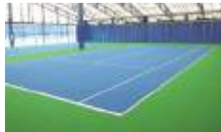
室内ノンサンド人工芝