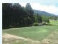
ティーグラウンド