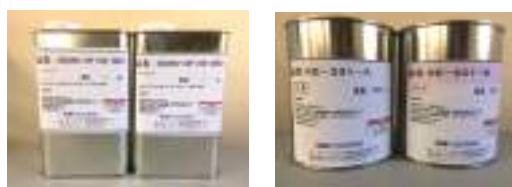
人工芝用接着剤 ゴムチップ用バインダー