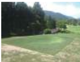
ティーグラウンド