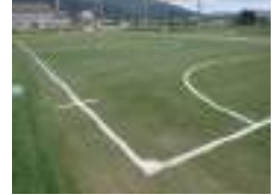
フットサルコート