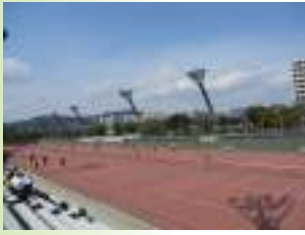
人エクレーコート