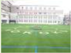
ロゴ入りサッカー場