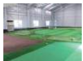
室内ゴルフ練習場