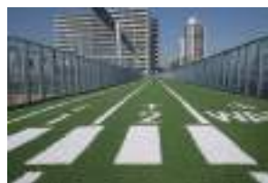
ランニングウェイ