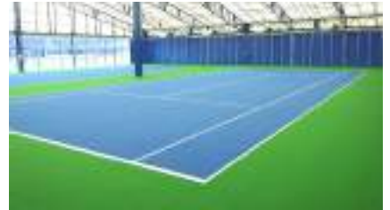
室内ノンサンド人工芝