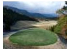
ティーグラウンド