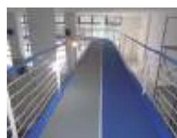
室内ランニングウェイ