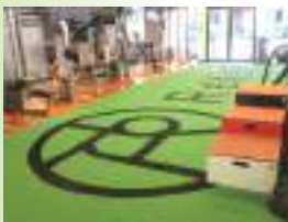
トレーニングジム